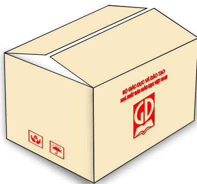
Kích thước bên trong hộp